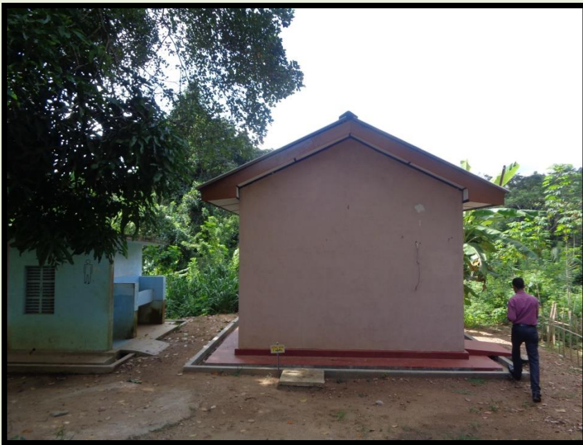
මො/ බෝගහපැලැස්ස විදුහල

විදුහල් වල අවශ්‍යතා සඳහා ළඟම පාසල හොඳම පාසල ව්‍යාපෘතිය යටතේ ලබාදුන් පහසුකම් ව්‍යාපෘතිය අවසන් කර තිබුණද ලබා නොගන්නා තත්වයක් නිරීක්ෂණය විය.