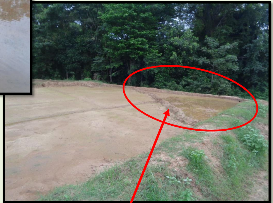
එක් පසක ජලය වැඩිපුර රැදීම හේතුවෙන් අමතර කෙටි නියරක් යොදා ඇති අයුරු