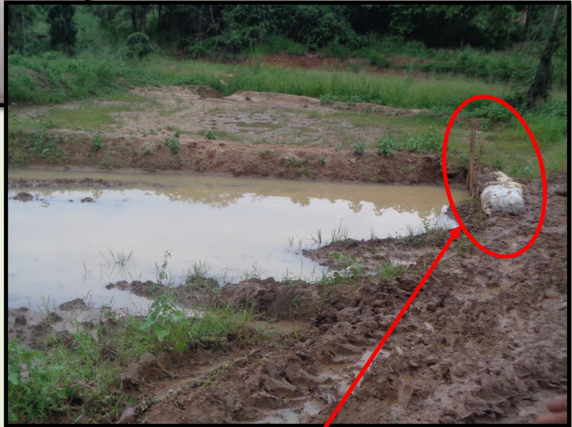
අනෙක් පසට ජලය රැස්වීමට වැලි කොටට පුරවා ලියද්දෙනි එක් පසක් ඔසවා ඇති අයුරු