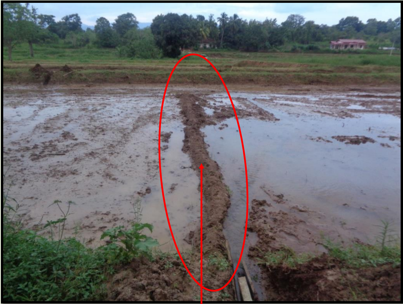
එක් පසක ජලය වැඩිපුර රැඳීම හේතුවෙන් අමතර කෙටි නියරක් යොදා ඇති අයුරු