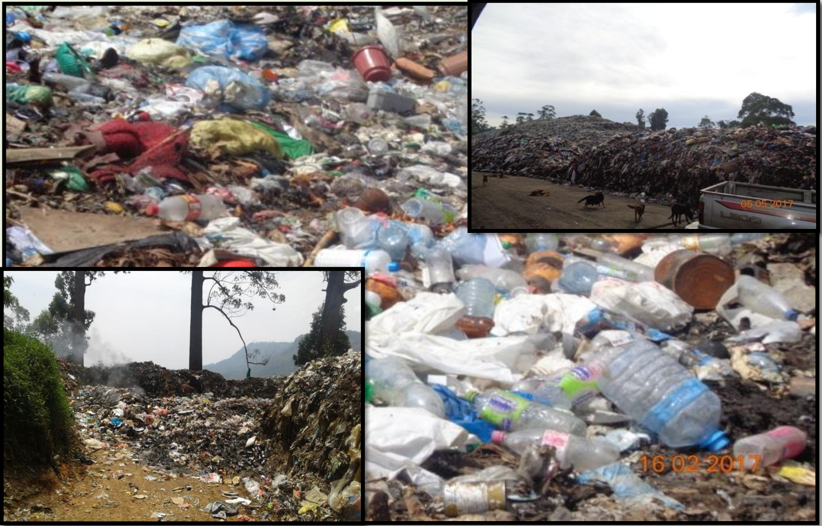
මහියංගන ප්‍රාදේශීය සභාව, හපුතලේ ප්‍රාදේශීය සභාව, බණ්ඩාරවෙල නගර සභාව