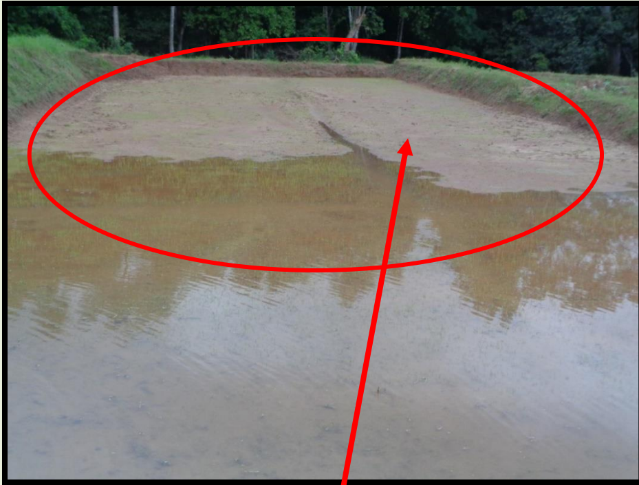
වී වපුරා ඇති ලියද්දක එක් පසක ජලය නොපිරෙන අයුරු